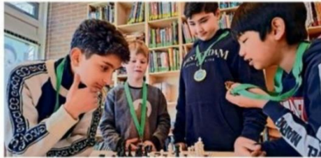
De Botteloef wint het Schoolschaaktoernooi

NOORD – Liefst 24 schoolteams uit Noord en IJburg deden afgelopen zondag mee aan de voorrondes van het Schoolschaaktoernooi. Dit toernooi, waar zo'n 250 teams aan deelnemen, wordt jaarlijks georganiseerd door Schaakbond Groot-Amsterdam voor basisscholen uit Amsterdam en omstreken.