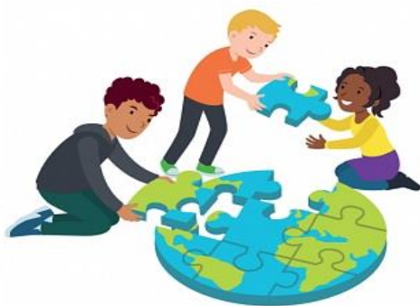
We dragen allemaal een steentje bij

Met een steentje bijdragen bedoelen we niet alleen leerlingen de kans geven om iemand te helpen. Het kan ook gaan om meedenken over een onderwerp dat hen aangaat. Dit gebeurt tijdens de lessen in de klas en binnenkort kunnen de kinderen ook hun ideeën kwijt in de hal van de school. Daar zal een complimenten- en klachtenbus komen te hangen. Deze bus is ook voor de ouders bedoeld. Leerlingen en ouders vormen voor ons een belangrijke bron van reflectie. Doen we de dingen goed? En doen we de goede dingen? Complimenten helpen ons altijd. Maar ook opbouwende kritiek is welkom.